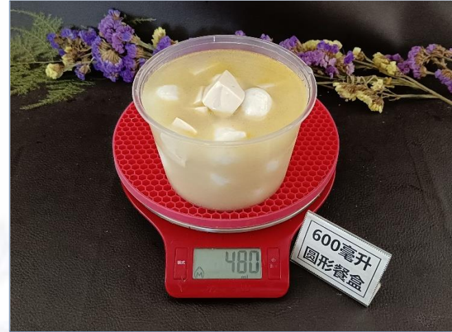
↑ 600毫升圆形餐盒 盛装480克成品汤