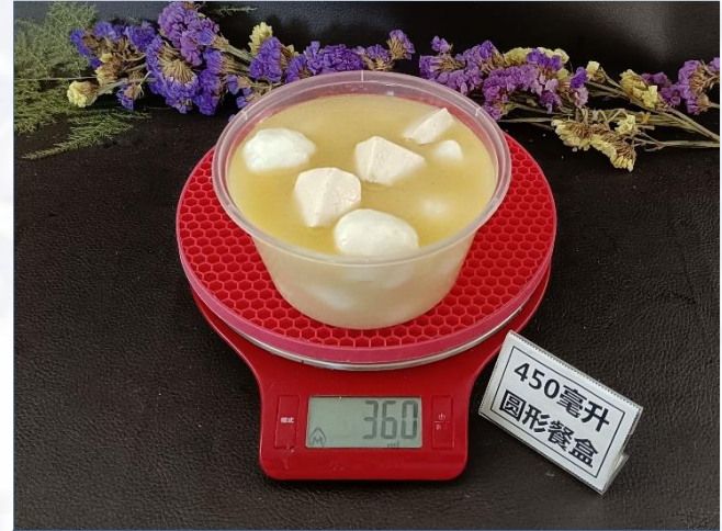
↑ 450毫升圆形餐盒 盛装360克成品汤