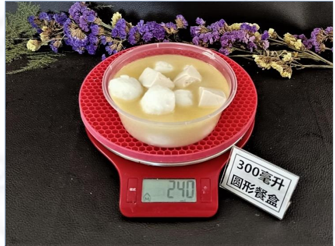
↑ 300毫升圆形餐盒 盛装240克成品汤