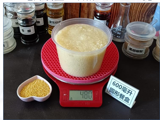
↑ 600毫升圆形餐盒 盛装480克成品粥