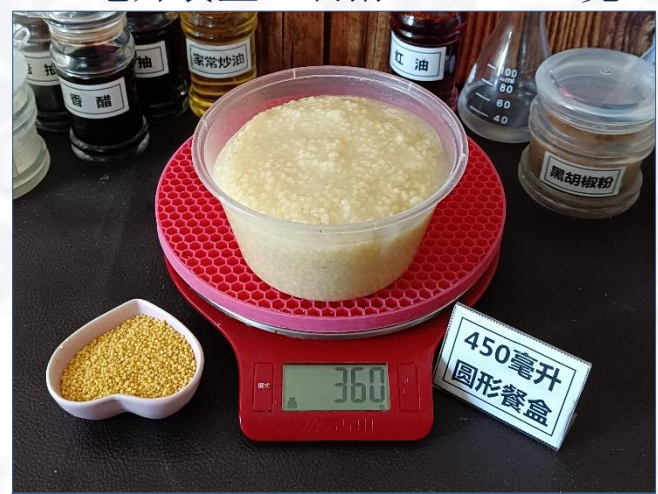
↑ 450毫升圆形餐盒 盛装360克成品粥