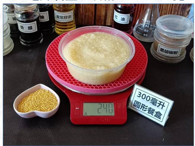
↑ 300毫升圆形餐盒 盛装240克成品粥