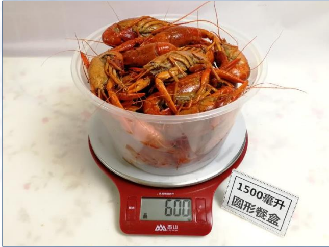
↑ 1500毫升圆形餐盒 盛装600克成品菜