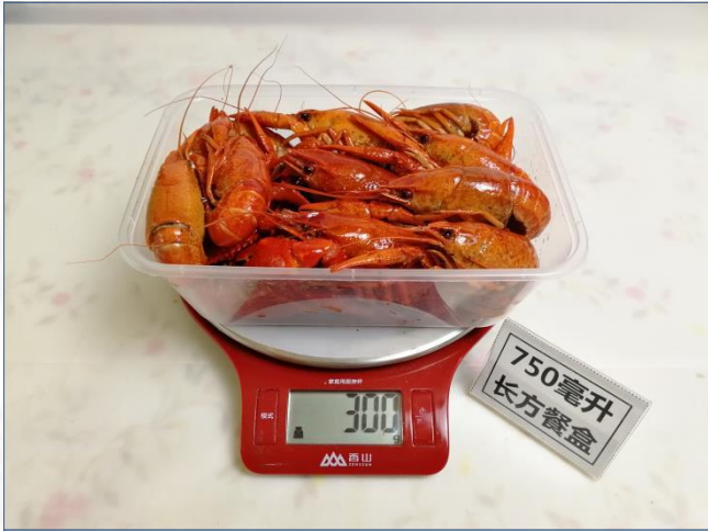
↑ 750毫升圆形餐盒 盛装300克成品菜