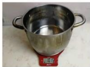
210501家里不锈钢锅称重1015克