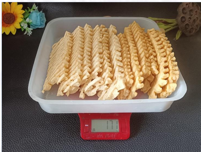
①12片兰花豆干油炸坯料 171克，平均约14.3克/片