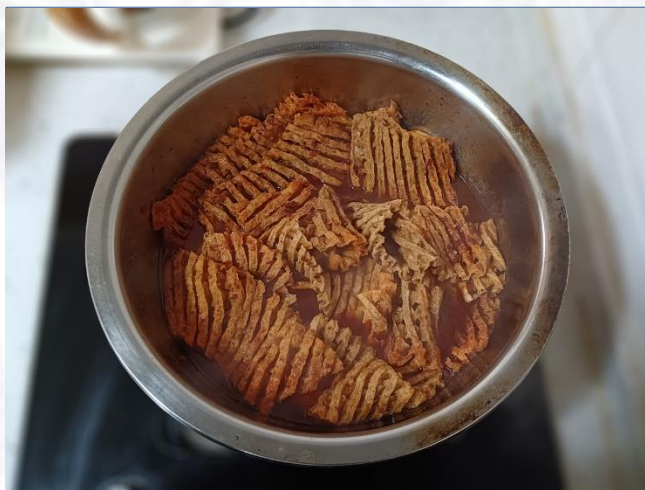
②卤煮20分钟后关火，浸 泡1小时以上。