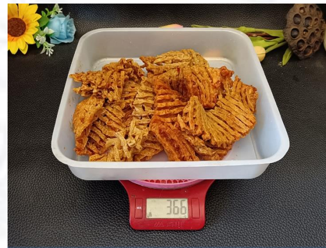
④卤熟沥汤汁后366克，成 熟率214%；约30.5克/片