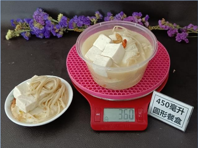
↑ 450毫升圆形餐盒 盛装360克成品汤