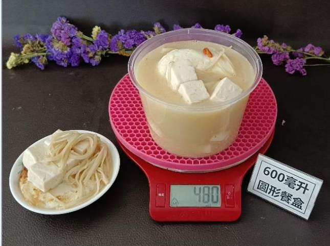
↑ 600毫升圆形餐盒 盛装480克成品汤