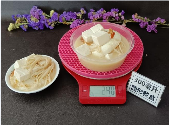
↑ 300毫升圆形餐盒 盛装240克成品汤