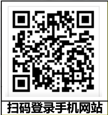
扫码登录手机网站