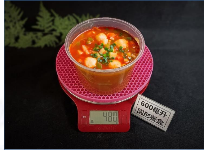
↑ 600毫升圆形餐盒 盛装480克成品汤