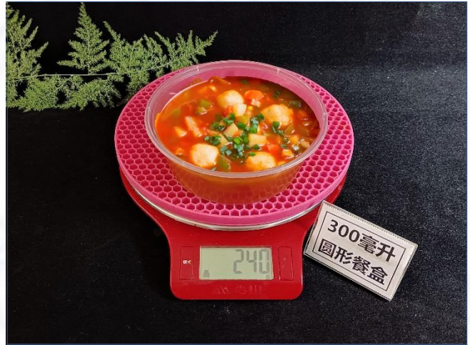
↑ 300毫升圆形餐盒 盛装240克成品汤