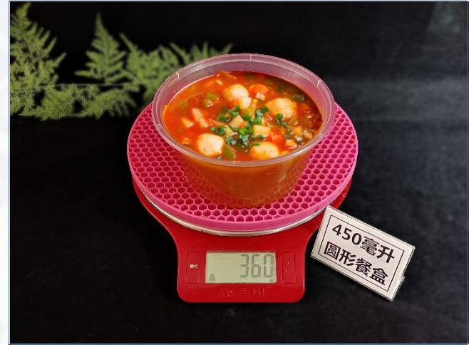
↑ 450毫升圆形餐盒 盛装360克成品汤