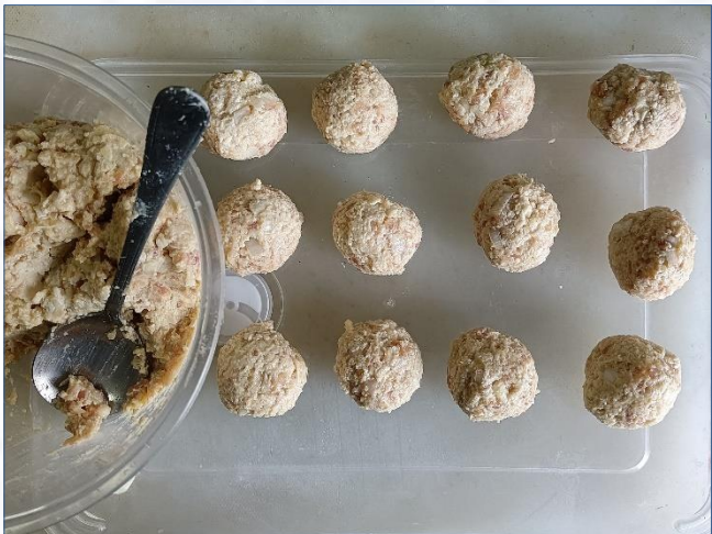
②挤出24个圆子 平均每个25克