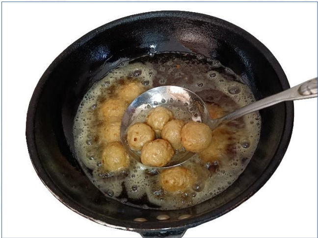
③油炸至熟 实耗炸油23克