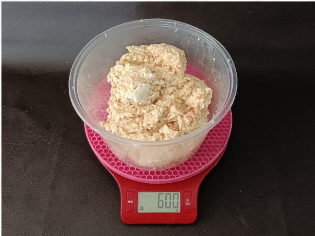
①预制豆腐猪肉馅 600克