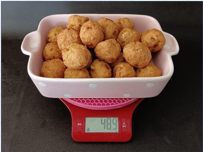
④成品豆腐圆489克 馅料+油合计成品率80.8%