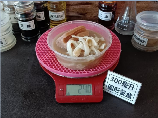
↑ 300毫升圆形餐盒 盛装240克糊豆丝