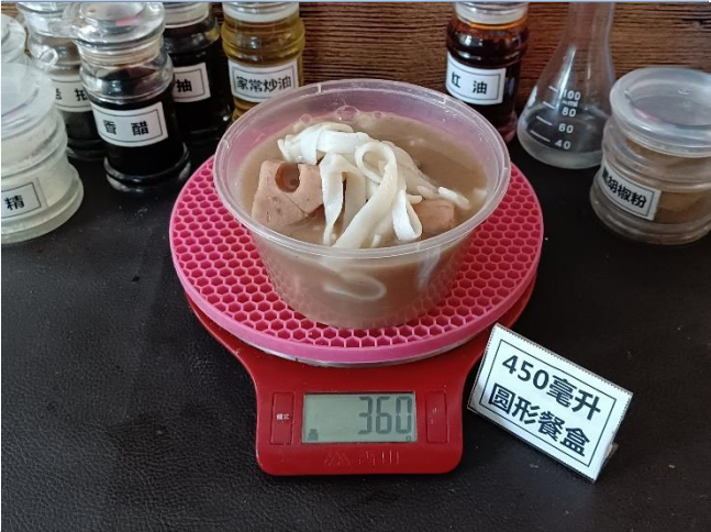
↑ 450毫升圆形餐盒 盛装360克糊豆丝