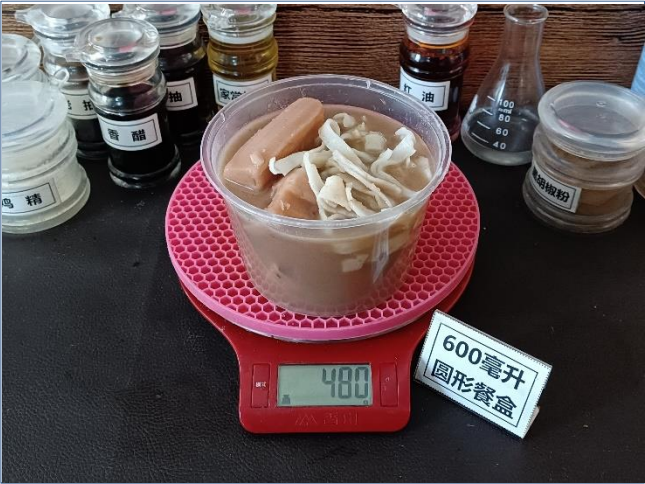
↑ 600毫升圆形餐盒 盛装480克糊豆丝