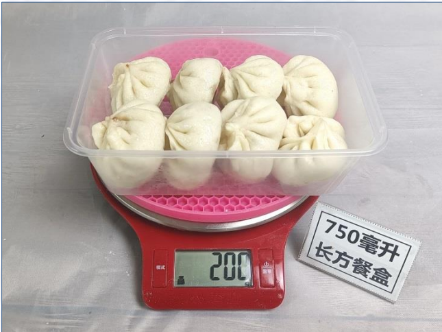
↑ 750毫升长方餐盒 盛装200克•8个包子