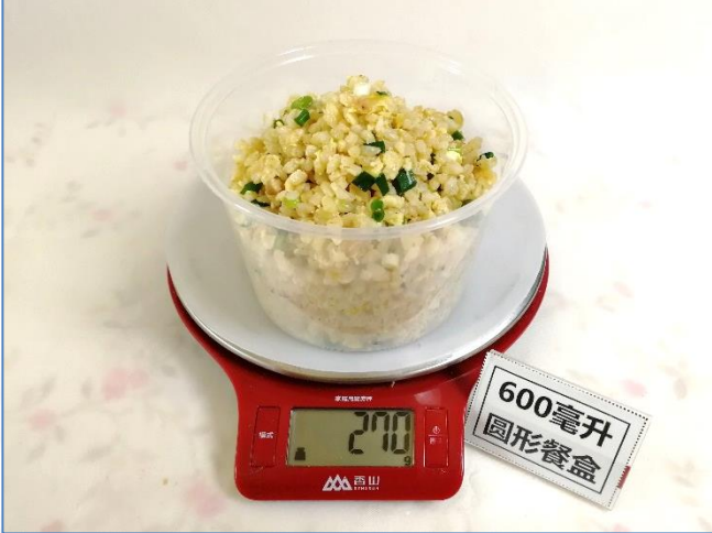
↑ 600毫升圆形餐盒 盛装270克成品饭