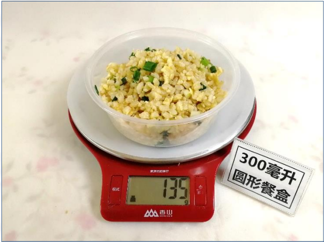
↑ 300毫升圆形餐盒 盛装135克成品饭