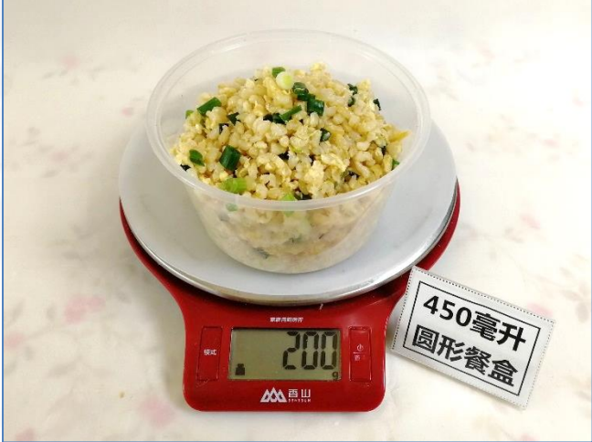
↑ 450毫升圆形餐盒 盛装200克成品饭