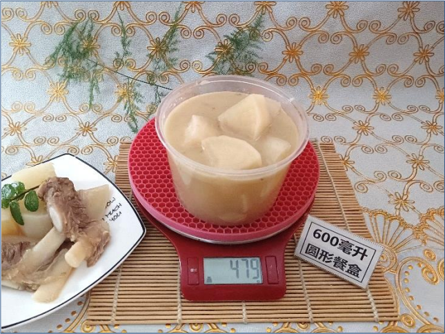
↑ 600毫升圆形餐盒 盛装480克成品汤