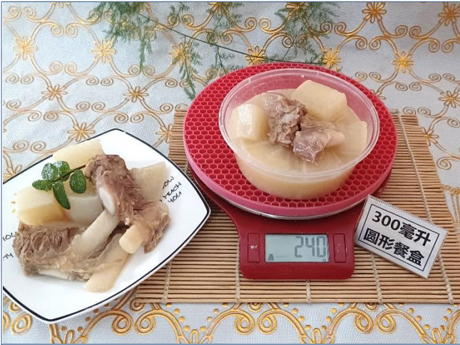
↑ 300毫升圆形餐盒 盛装240克成品汤