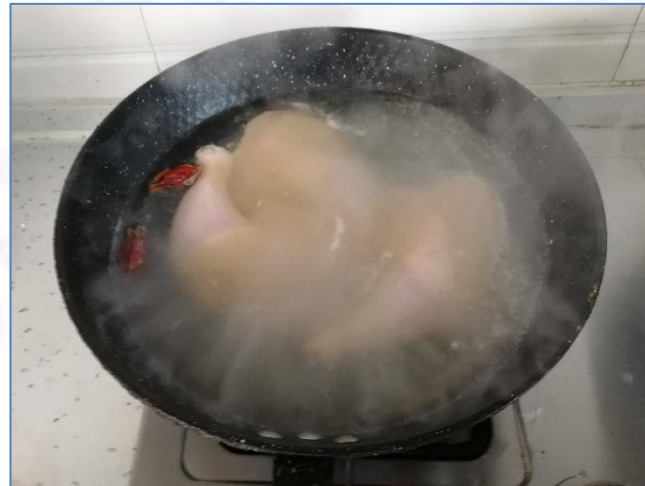
锅内放清水、调料 煮鸡腿