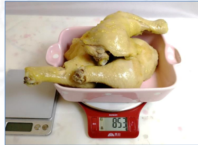
取出鸡腿沥水 晾凉称重853克