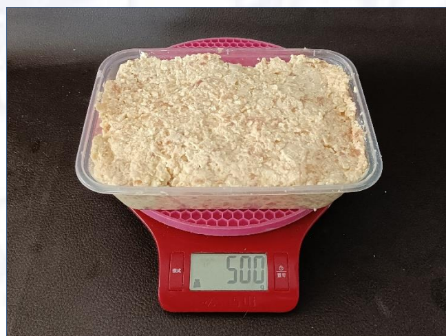
①预制豆腐猪肉馅 500克