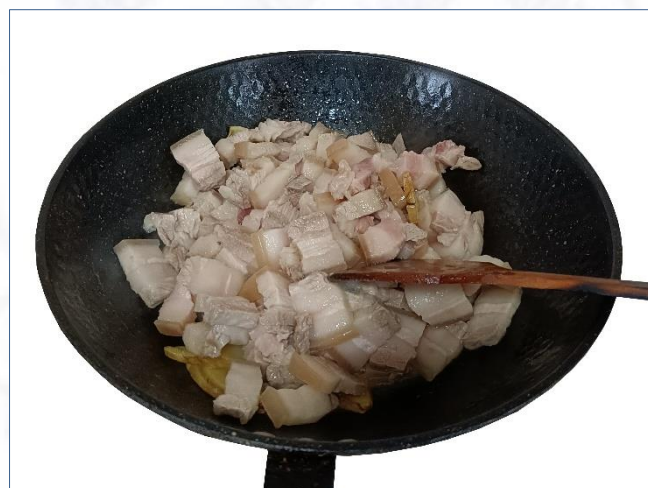
③切成肉片 煸炒红烧