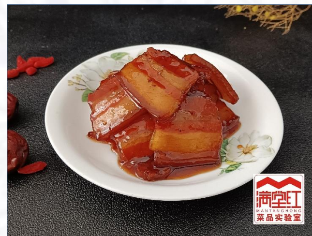
④成品（配菜） 红烧肉片