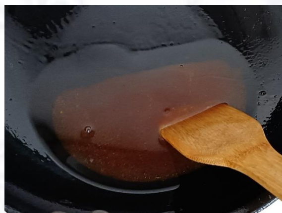
7) 中小火熬制糖化开