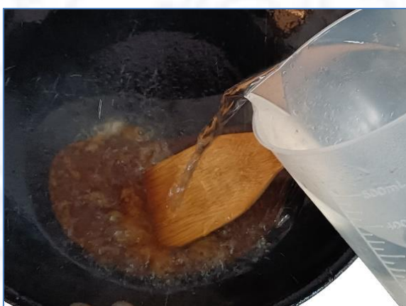
9) 大泡转小泡加开水