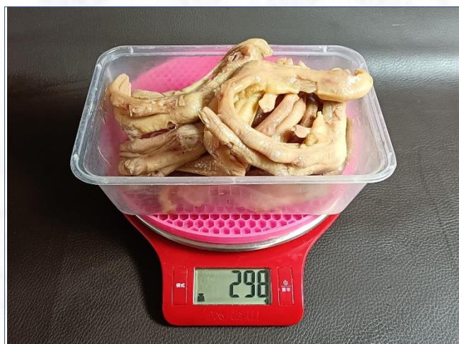
③卤熟鸭掌298克， 卤熟成品率83.7%