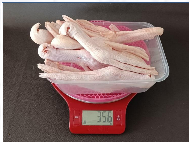
①9个解冻鸭掌356克， 平均39.5克/个