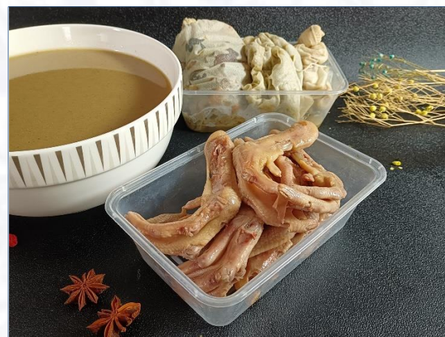
成品 白卤水卤鸭掌