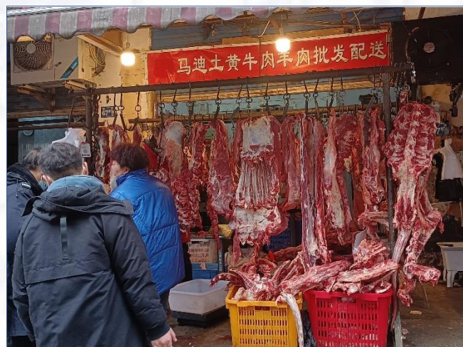
①到市场购买新鲜未注水牛肉，37元/斤