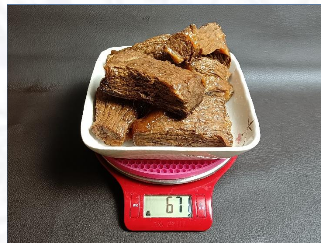
④成品卤牛肉671克， 成品率52.5%