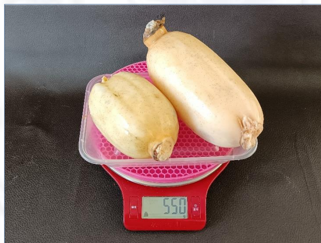
2022年2月25日第四次测试 ①老莲藕2节550克