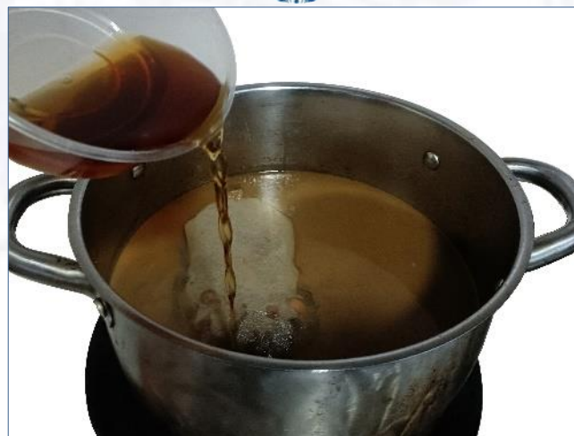
④放入红卤水内，小火焖煮10分钟，关火浸泡1小时、捞出后沥去卤汁即成