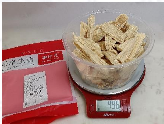
③沥水后称重496克， 涨发率200%/平均209%