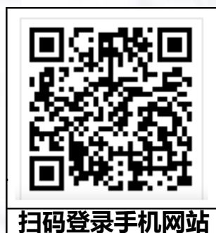
扫码登录手机网站

——也就是：根据“主要”原料进货单价的不同，我们将同步作出“12种”不同的成本数据分析供您参考。