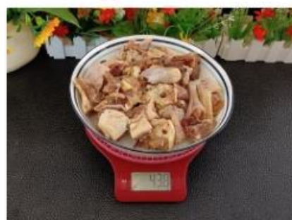
IMG_20240821_092014 - 副本