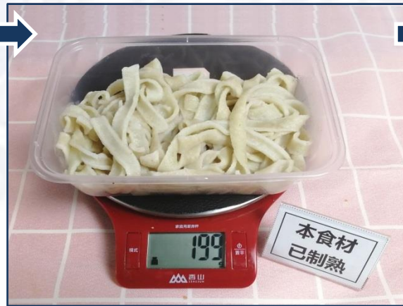
②将干豆丝煮熟、沥水 ↑