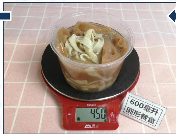
⑤加上藕汤后的成品 ↑