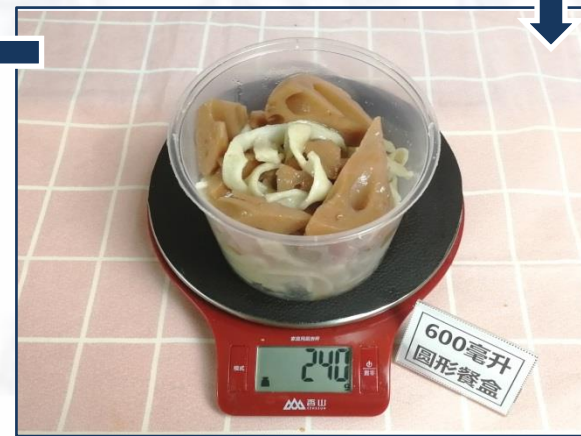
④加上熟莲藕后的称重 ↑